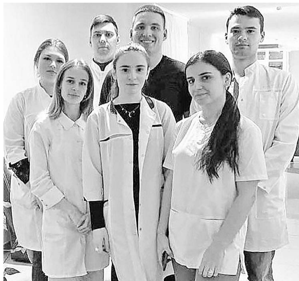
Бригада ординаторов Первого Санкт-Петербургского государственного медицинского университета имени академика И.П. Павлова готова приступить в работе в Старорусской ЦРБ.

В настоящее время новгородским медикам помогают коллеги из Северо-Западного государственного медицинского университета им. И.И. Мечникова, Национального медицинского исследовательского центра хирургии им. А.В. Вишневского и Первого Санкт-Петербургского государственного медицинского университета имени академика И.П. Павлова.